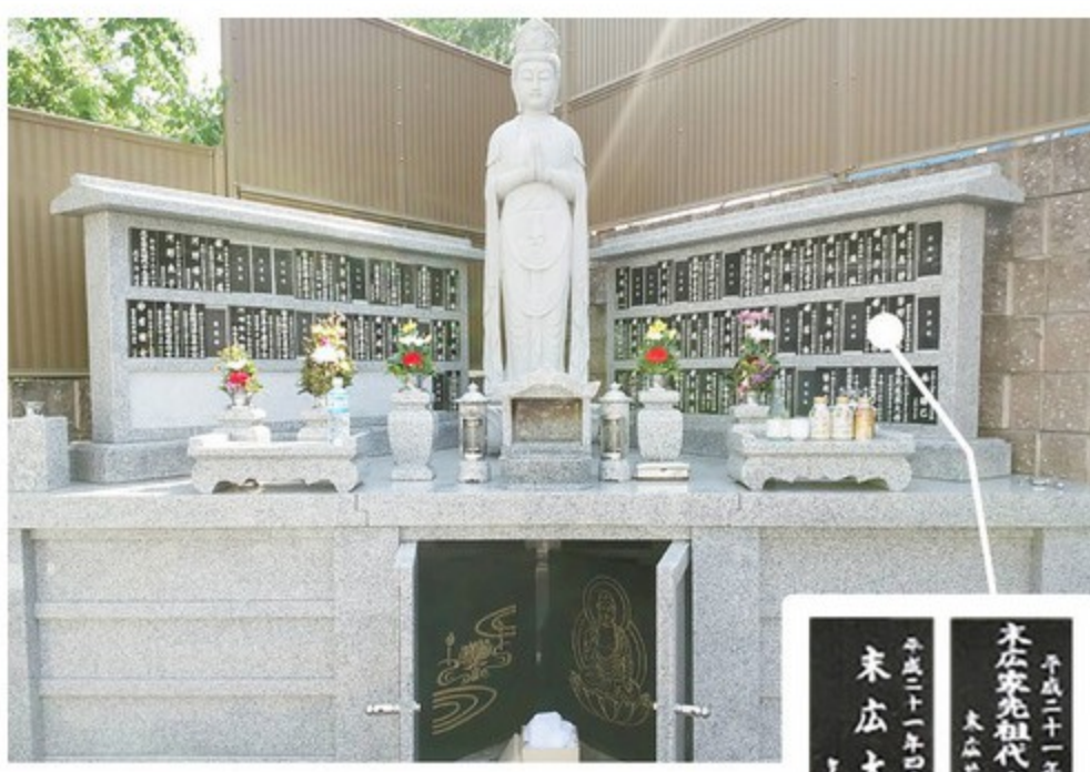
故人をお墓に埋葬する際に戒名・俗名などを彫刻します。銘板は永代供養墓に設置され末永く供養いたします。

永代供養墓にお名前を彫刻した黒御影石の銘板を設置。この世に「生きた証」を刻み、永代に渡り供養させていただきます。できる限り手厚くご供養したいという方におすすめしております。